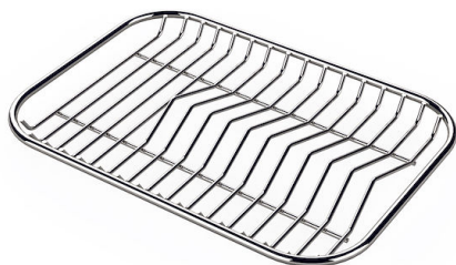
GRILLE PORTE-ASSIETTES INOX 25x35

* uniquement en combinaison avec l'accessoire A644 A01