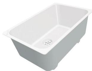
CUVETTE PLASTIQUE BLANCHE

* uniquement en combinaison avec l'accessoire A644 F04