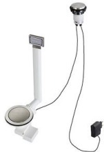
VIDAGE FADE LIGHT A407 A17